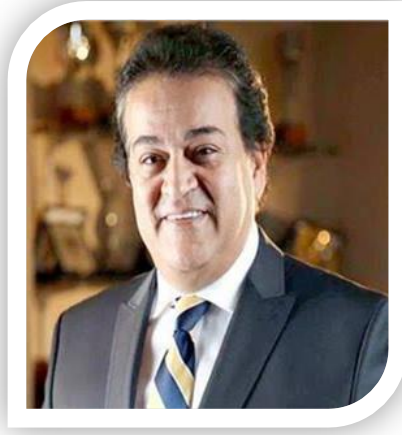
الاستاذ الدكتور/ خالد عبدالغفار وزير التعليم العالي والبحث العلمي