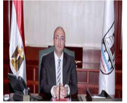
الدكتور/ محمد هانى محافظ بني سويف