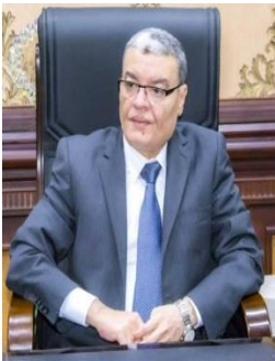
اللواء/ أسامه القاضي محافظ المنيا