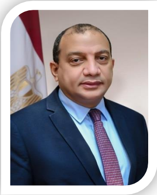
الأستاذ الدكتور/ منصور حسن رئيس جامعة بني سويف