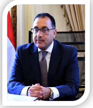
الدكتور/ مصطفى مدبولي رئيس مجلس الوزراء